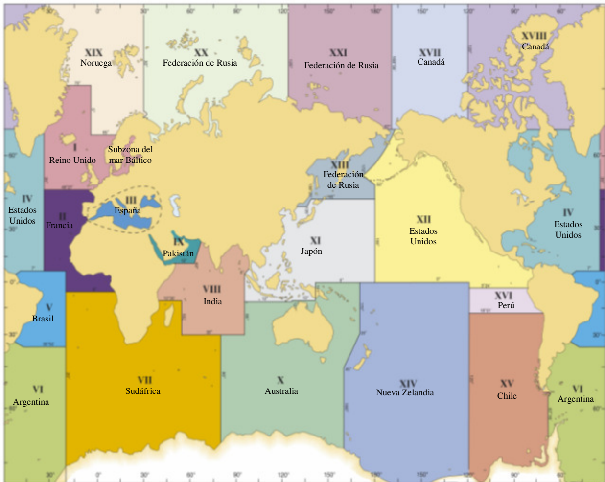
Figura 2: Zonas NAVAREA para la coordinación y difusión de radioavisos náuticos en el marco del Servicio mundial de radioavisos náuticos

La delimitación de estas zonas no guarda relación con las líneas fronteras entre Estados, ni irá en perjuicio del trazado de las mismas.