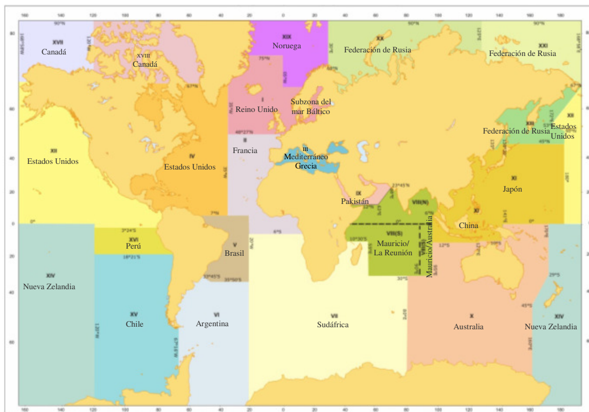
Figura 4: Zonas METAREA para la coordinación y difusión de radioavisos y pronósticos meteorológicos en el marco del SMSSM

La delimitación de estas zonas no guarda relación con las líneas de fronteras entre Estados, ni irá en perjuicio del trazado de las mismas.